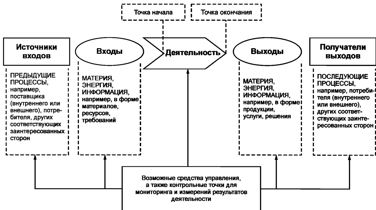
Рисунок 1 — Схематичное изображение элементов процесса

Рисунок 1 дает схематичное изображение любого процесса и иллюстрирует взаимосвязь элементов процесса. Контрольные точки мониторинга и измерения, необходимые для управления, являются специфическими для каждого процесса и будут варьироваться в зависимости от соответствующих рисков.